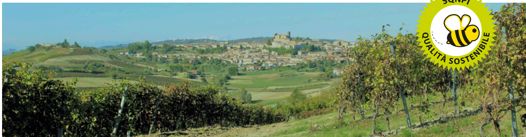
- Uno scorcio del paese di Casorzo -

La nostra Cantina, da 12 anni inoltre, usufruisce di un impianto di fitodepurazione e di un sistema di pannelli fotovoltaici di 12 mq, possedendo macchinari a corrente elettrica.